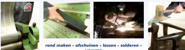
rond maken - afschuinen - lassen - solderen - vouwen

Wij vervaardigen alle producten volgens de wensen van de klant - daarbij werken onze ervaren dakdekkers & plaatwerkers volgens beproefde mechanische bewerkingsmethoden.